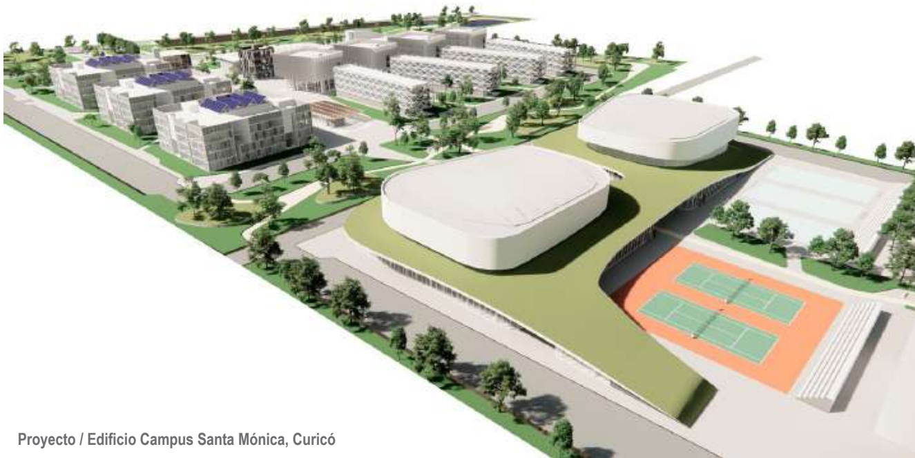
Proyecto / Edificio Campus Santa Mónica, Curicó

incluye aportes basales, aporte fiscal directo, financiamiento regional y otros-, por lo tanto, lo que se requiere es que nuestro presupuesto se ajuste a los ingresos que efectivamente vamos a recibir, práctica que hemos hecho durante todos estos años, como ya mencioné, tenemos que ser ordenados y responsables en la gestión financiera. Nuestro principal desafío y por ello nuestro criterio principal, es definir prioridades que aseguren el desarrollo del proyecto formativo de la Institución, y eso tiene que seguir siendo así, un ordenamiento administrativo y operativo para mantener el equilibrio económico y financiero.