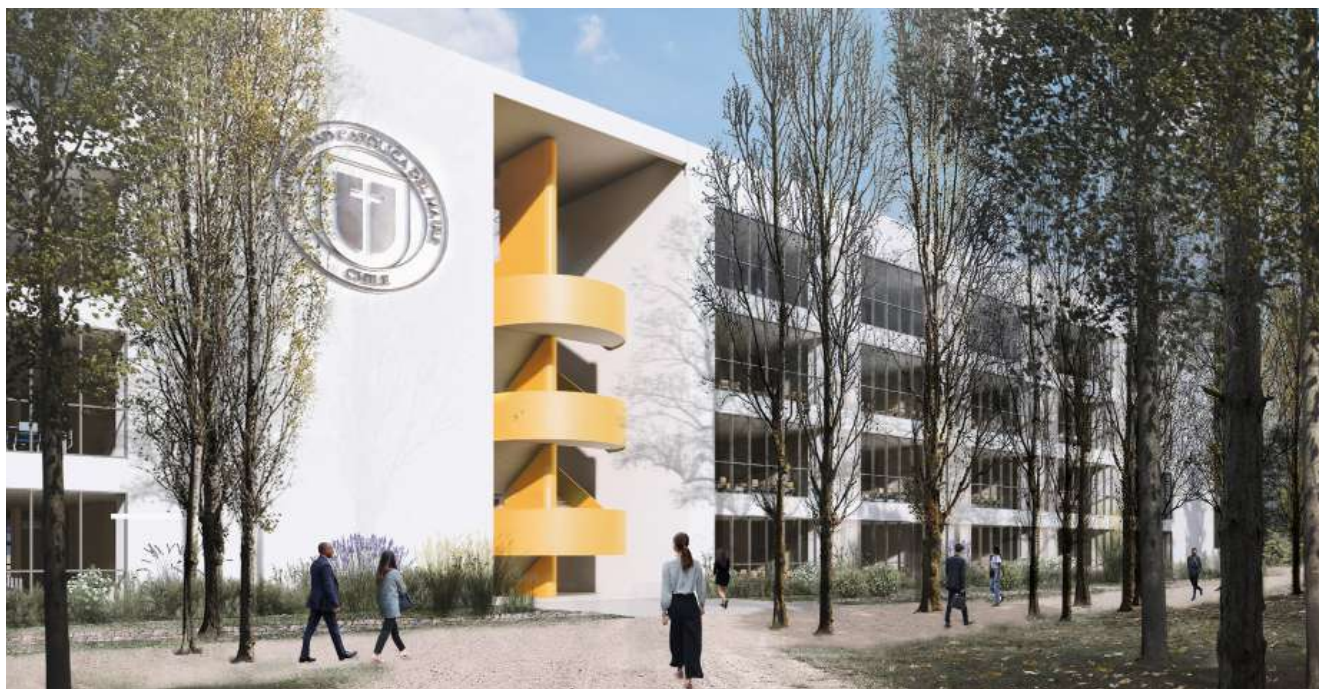
Edificio Aula II / Campus San Miguel, Talca

La UCM ha sorteado desafíos importantes en el último tiempo, no es la misma de hace 10 años. Todos estos logros son producto del trabajo de las personas que la componen. Podemos tener la mejor infraestructura o sistemas de información muy potentes dentro de la Institución, pero siguen siendo las personas las que sustentan la Universidad, por lo tanto, nada sería posible sin el apoyo, la colaboración y el compromiso de todas las personas que la integran, es algo que indudablemente se debe reconocer y nadie se queda excluido de ese compromiso. El llamado es a seguir manteniendo este compromiso para que la UCM no se detenga y estamos llamados a ser una Universidad de primer nivel.